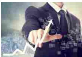
TAMBURI – INVESTE IN BENDING SPOONS