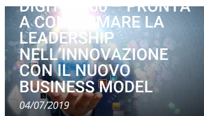
DIGITAL 2020 – PRONTA A CONSUMARE LA LEADERSHIP NELL'INNOVAZIONE CON IL NUOVO BUSINESS MODEL