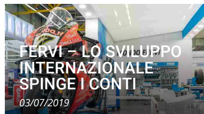
FERVI – LO SVILUPPO INTERNAZIONALE SPINGE I CONTI