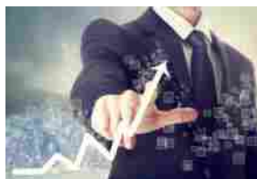
TAMBURI – ESERCITATI 7,6 MLN DI WARRANT, INCASSO DI 37,8 MLN