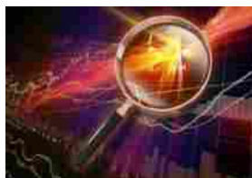
ANALISI TECNICA – TAMBURI IP: TREND RIBASSISTA DI BREVE PERIODO ANCORA IN FORZA